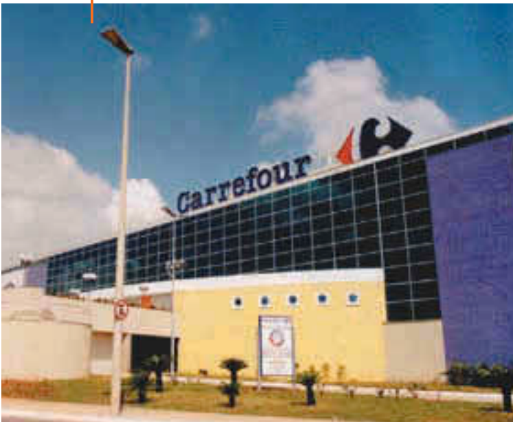
Hipermercado Carrefour Belo Horizonte | MG