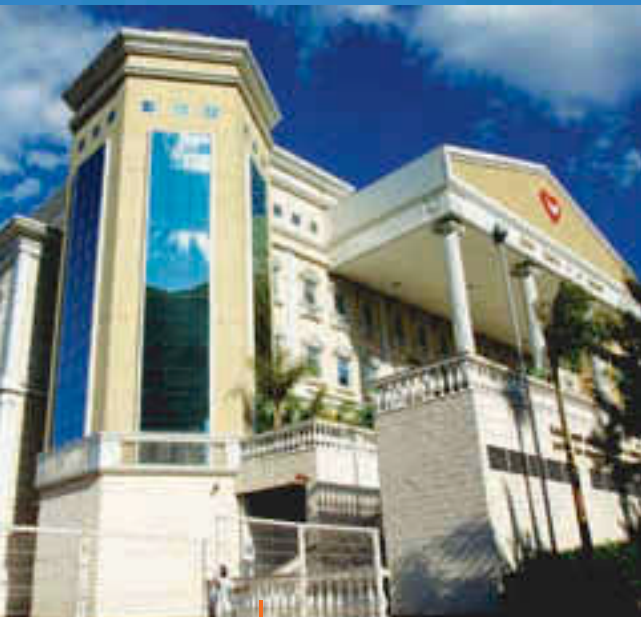
Igreja Universal do Reino de Deus Belo Horizonte | MG